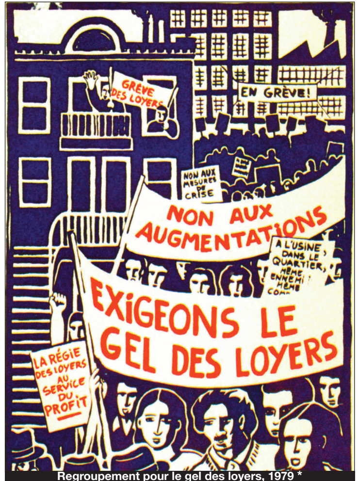
Regroupement pour le gel des loyers, 1979 *

Association québécoise pour la défense des droits des retraités et pré-retraités du Québec, 1980 *