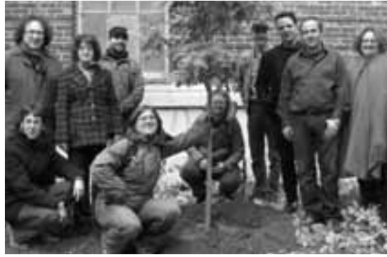
PLANTATION D'UN CHÊNE ROUGE POUR SOULIGNER L'IMPORTANCE DES GROUPES COMMUNAUTAIRES AUTONOMES. CET ARBRE FUT PLANTÉ DANS LE CADRE DE LA JOURNÉE NATIONALE DE L'ACTION COMMUNAUTAIRE LE 20 OCTOBRE 2009.