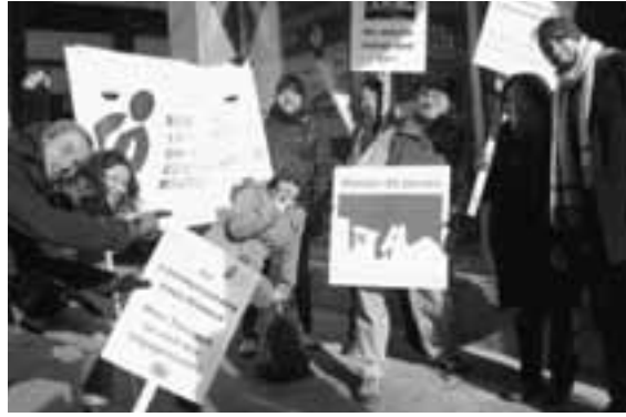
MOBILISATION-ÉCLAIR DEVANT LES BUREAUX DE LISE THÉRIAULT AFIN DE REVENDIQUER DAVANTAGE DE FINANCEMENT POUR LES GROUPES COMMUNAUTAIRES, LE 23 OCTOBRE 2009.