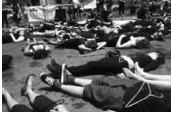
DEVANT LES MENACES SANS CESSER GRANDISSANTES DES CONSERVATEURS À NIER LE DROIT À L'AVORTEMENT, LA FÉDÉRATION DES FEMMES DU QUÉBEC A ORGANISÉ UNE ACTION SYMBOLIQUE À MONTRÉAL. LE RIOCM Y ÉTAIT!