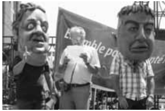
SCÉNETTE HUMORISTIQUE METTANT EN VEDETTE JEAN CHAREST ET YVES BOLDUC LORS DE LA MANIFESTATION POUR LE DROIT À LA SANTÉ DE LA COALITION SOLIDARITÉ SANTÉ DEVANT LA CONFÉRENCE DE MONTRÉAL, LE 9 JUIN 2010.